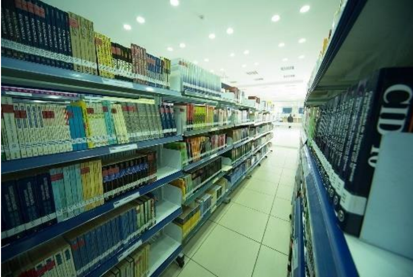
Fotografia 1 – Acervo da biblioteca