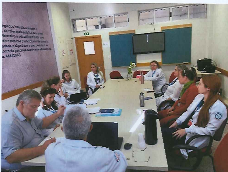
Figura 8: sala 74, Colegiado em reunião do CEP