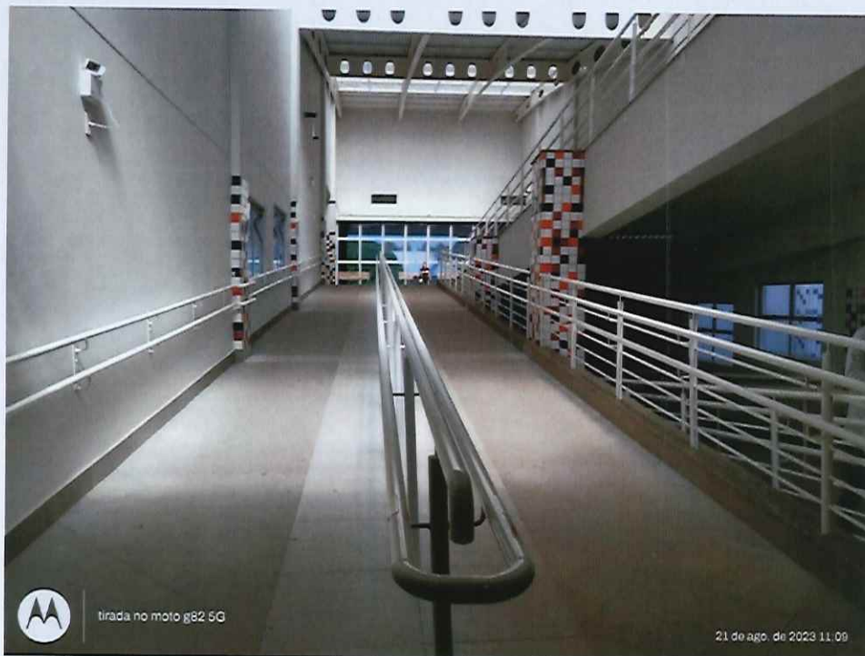
Figura 3: Corredor do Bloco I, sala do CEP