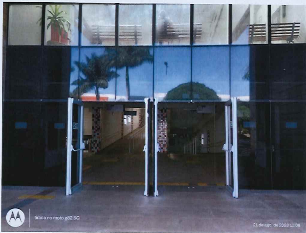
Figura 1: Entrada principal do Bloco I, salas de aulas, do CEP e laboratórios