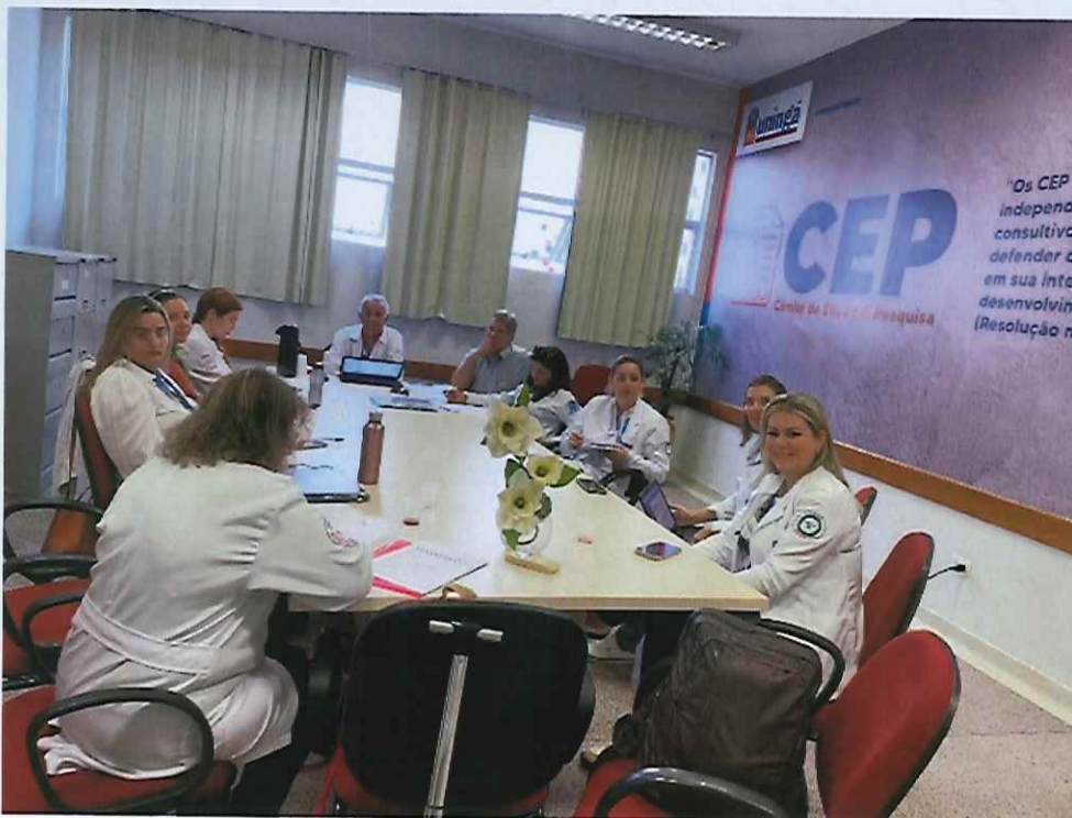
Figura 7: sala 74, Colegiado em reunião do CEP