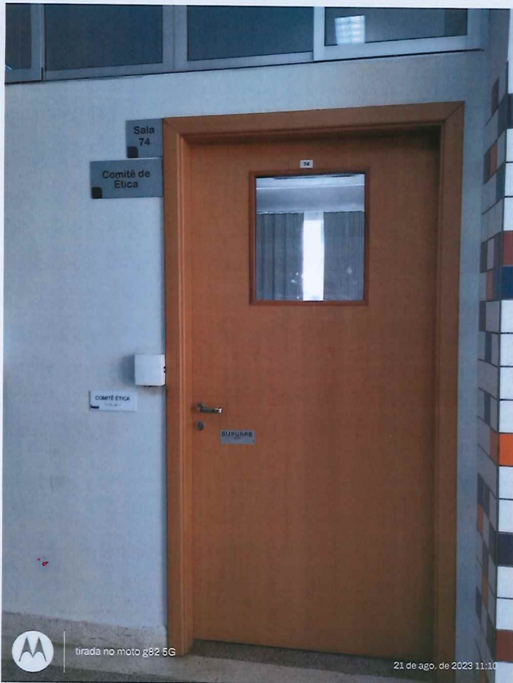
Figura 4: Porta de acesso, à sala 74, do CEP