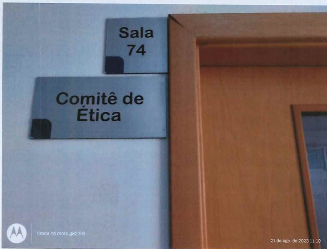
Figura 5: Porta de acesso, à sala 74, do CEP