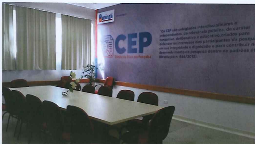
Figura 6: sala 74, do CEP