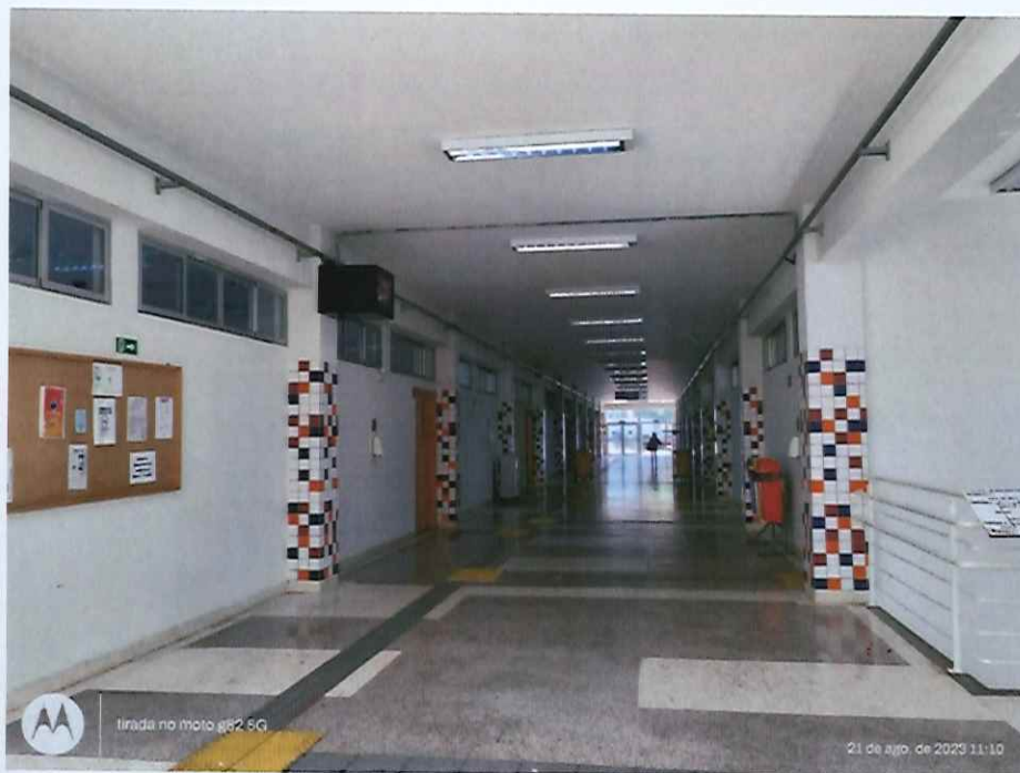
Figura 2: Corredor do Bloco I, sala do CEP