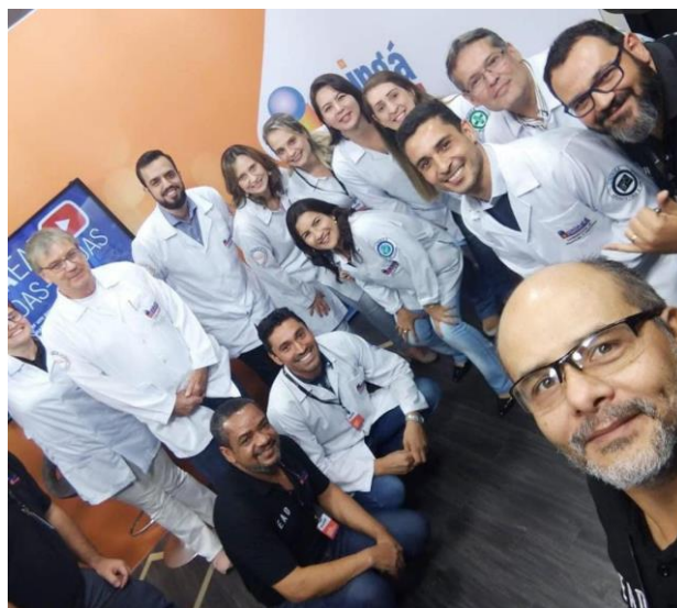
Figura 5. Live do Boas-Vindas da Entrada 3/2019 (02/08/2019).