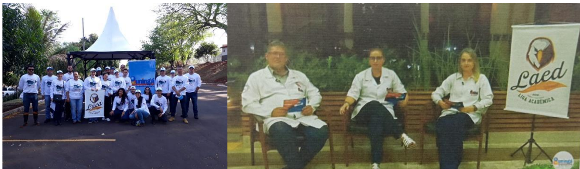
Figura 9. Atuação da LAED no Dia Mundial de Limpeza de Rios e Praias (à esquerda) e I Web Jornada Acadêmica da Uningá (à direita).

A liga esteve presente e foi atuante em projetos acadêmicos como a “I Web Jornada Acadêmica da Uningá”, que ocorreu em outubro de 2019.