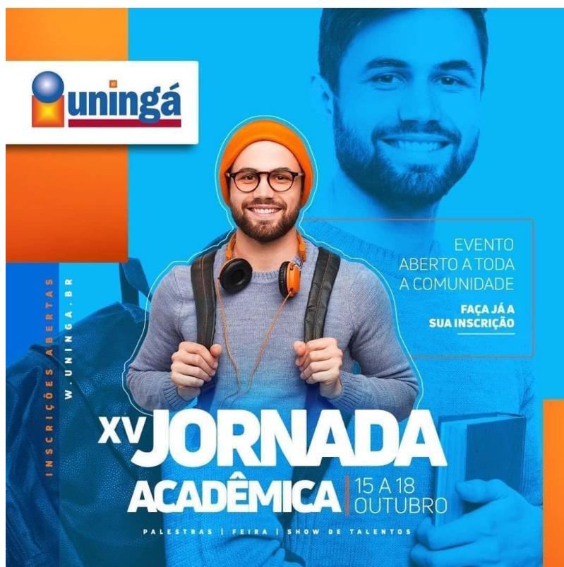
Figura 8. Divulgação para a inscrição na XV Jornada Acadêmica.

As inscrições foram feitas pelo site: https://www.uninga.br/noticia/estao-abertas-as-inscricoes-para-a-xv-jornada-academica-da-uninga/6653/